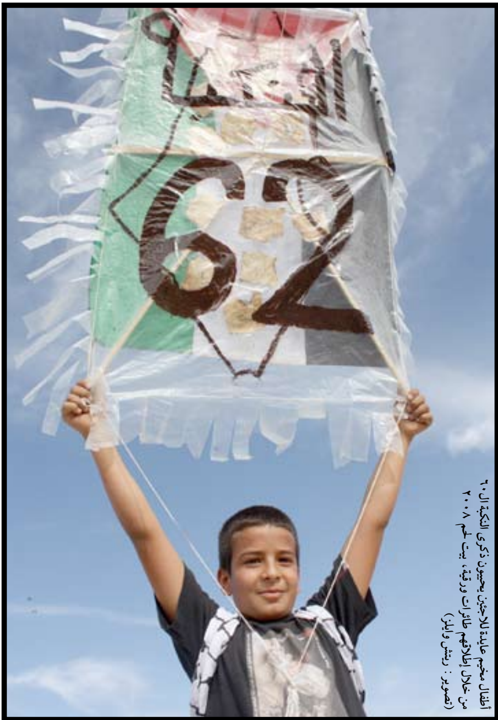
أطفال مخيم عابدة للاجئين يحميون ذكرى النكبة الـ ٦٠ من خلال إطلاقهم طائرات ورقية، بيت لحم ٢٠٠٨