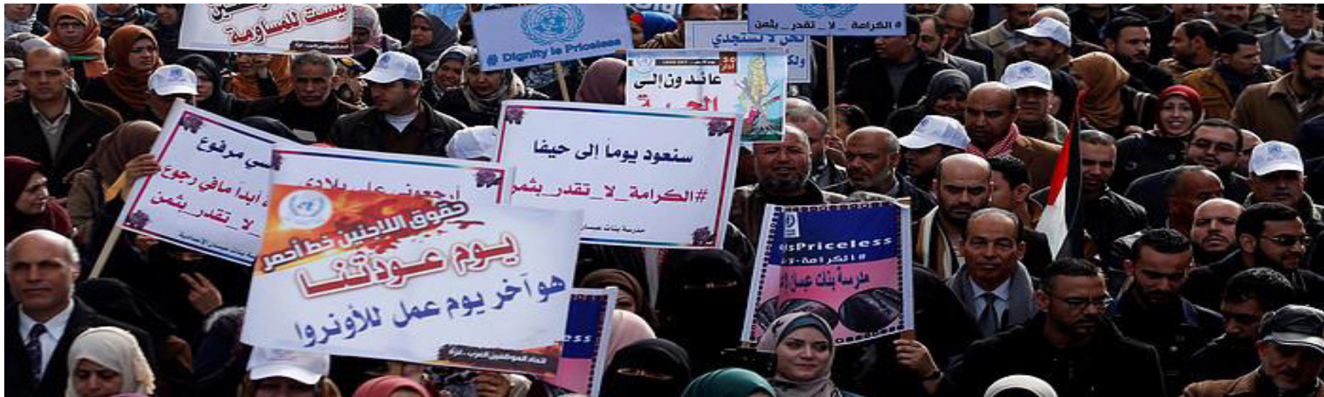
Una protesta contra las reducciones de los servicios de la UNRWA, La Franja de Gaza, 2018

El mandato de la UNRWA está vinculado a la aplicación de la Resolución 194 de la AGNU, que incluye el derecho de las personas palestinas desplazadas al retorno, la restitución de la propiedad y la indemnización. La revisión o el cese de su mandato es competencia exclusiva de la AGNU.