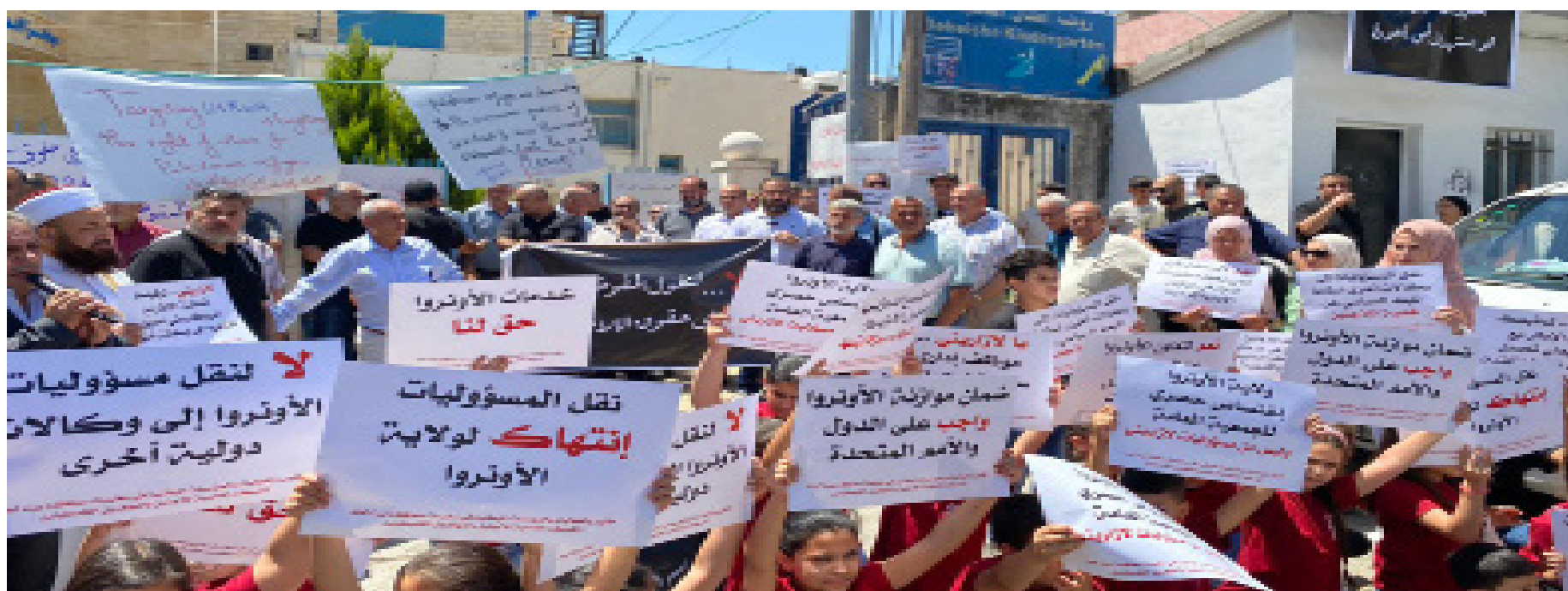
Una protesta organizada por la GPRN y el Sindicato Árabe del Personal de la UNRWA contra la campaña liderada por Israel para desmantelar el campo de refugiados de Dheisheh de la UNRWA, 2023:© (BADIL)