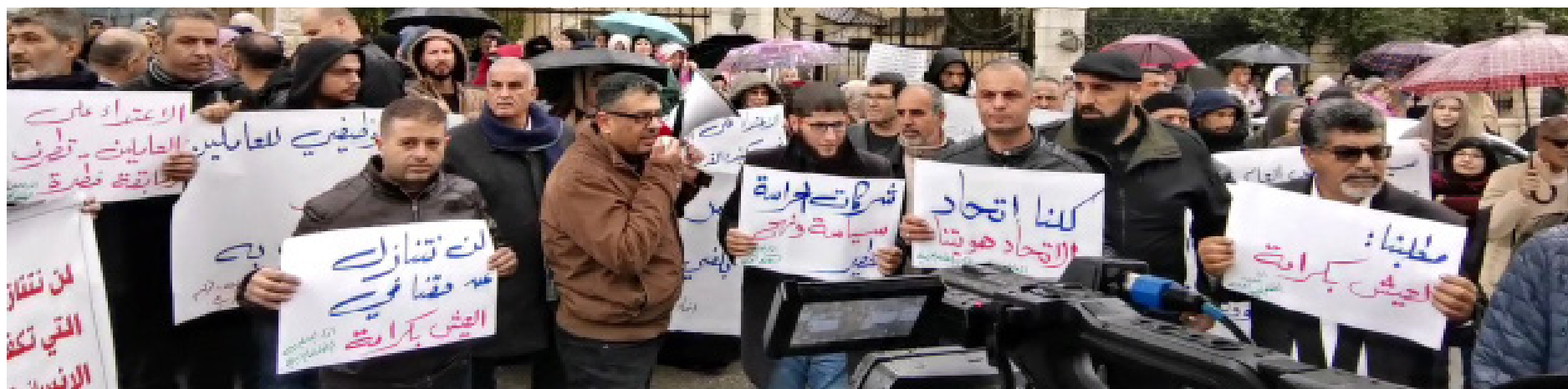
Protesta frente a la Oficina del Alto Comisionado de la ONU en Ramallah, 2023: © (BADIL)

Sí, apoyar, financiar y permitir el funcionamiento de la UNRWA es responsabilidad de la comunidad internacional hasta que se cumpla el derecho de las personas palestinas refugiadas a la reparación, incluidos el retorno, la restitución de la propiedad y la indemnización.