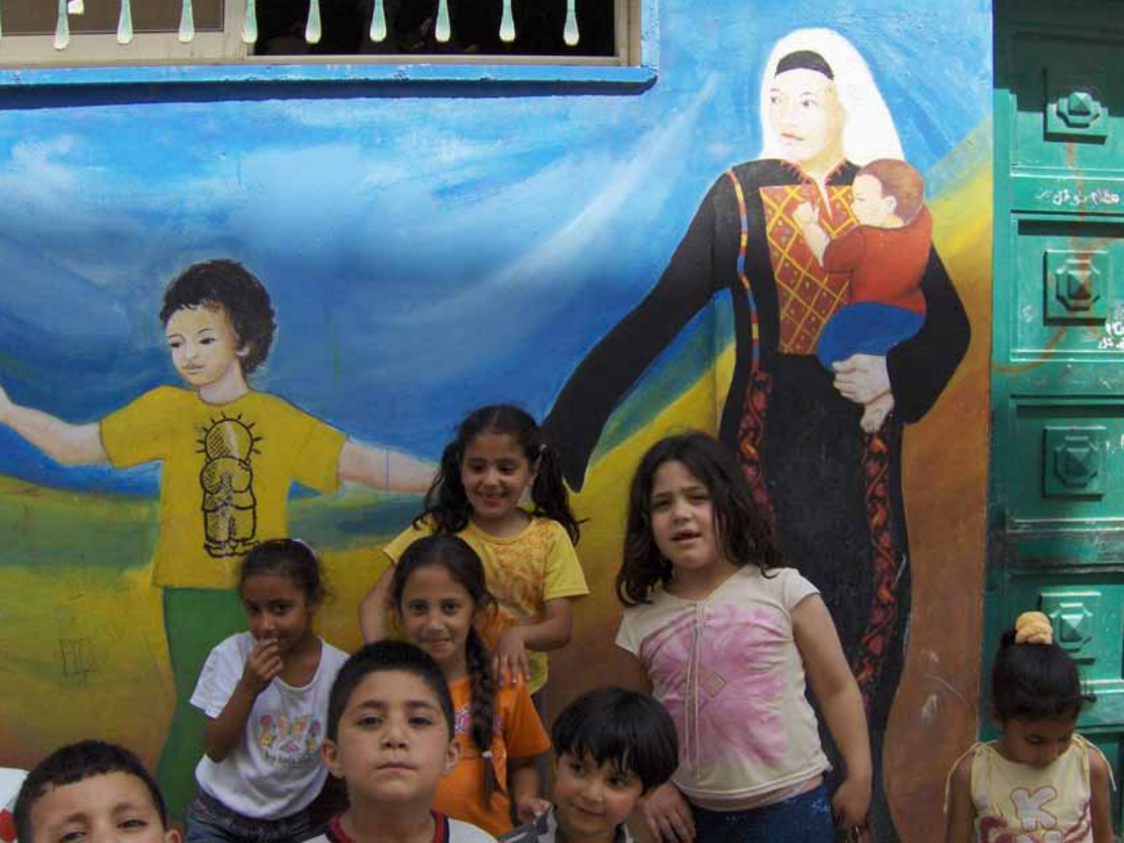
مخيم العزة/بيت جبرين، بيت لحم. أيار 2012

”تقرر وجوب السماح بالعودة، في أقرب وقت ممكن للاجئين الراغبين في العودة إلى ديارهم والعيش بسلام مع جيرانهم، ووجوب دفع تعويضات عن ممتلكات الذين يقررون عدم العودة إلى ديارهم وكذلك عن كل فقدان أو خسارة أو ضرر للممتلكات بحيث يعود الشيء إلى أصله وفقاً لمبادئ القانون الدولي والعدالة، بحيث يعوّض عن ذلك الفقدان أو الخسارة أو الضرر من قبل الحكومات أو السلطات المسؤولة“.