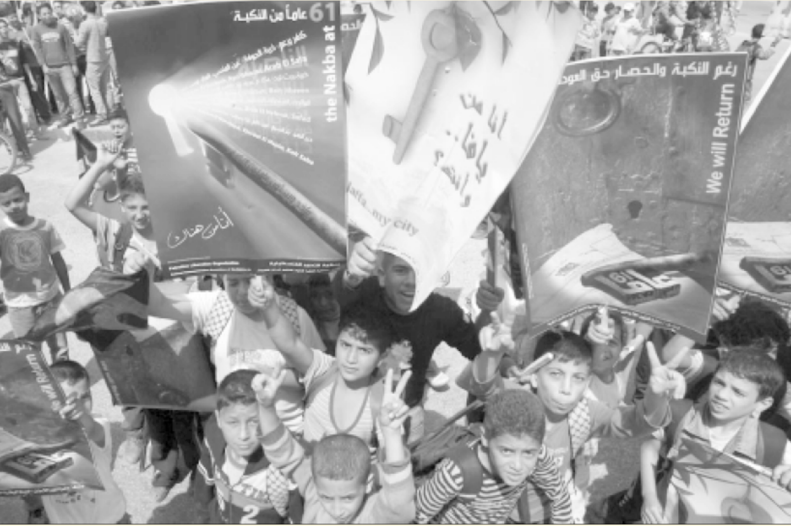
ضمن فعاليات إحياء ذكرى النكبة الـ٦١، نابلس، أيار ٢٠٠٩.

مخرجات البرامج والأنشطة التحدّيات، المشاكل، والحلول