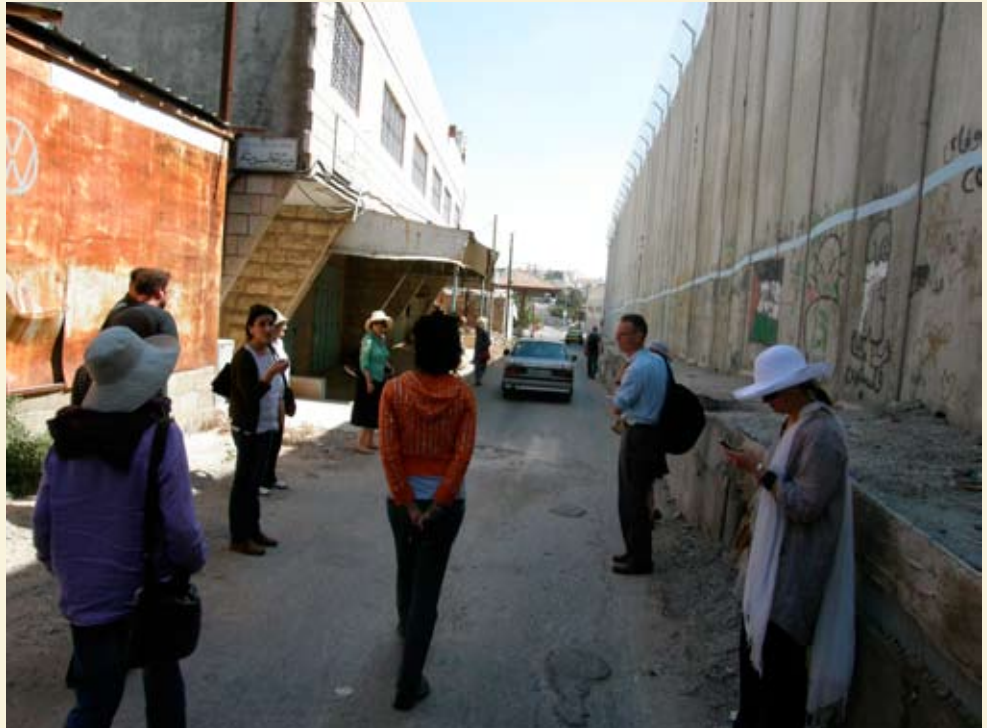
وفد المؤلفين والشخصيات الأدبية ضمن الجولة التي نظمها مركز بديل له في بيت لحم. أيار ٢٠٠٩.

قامت مؤسسة بديل نيابة عن اللجنة الوطنية لحملة المقاطعة باستضافة وتنظيم جولة تثقيفية للقائد الجنوب - أفريقي المناهض للفصل العنصري والمسؤول الرسمي لاتحاد عمال النقل والمواصلات في جنوب أفريقيا، السيد زيكو تاميلا. ومن ضمن جولته، تم تنظيم نقاش مفتوح مع ممثلين عن الاتحاد العام للنقابات العمالية الفلسطينية، وعن نقابة عمال النقل الفلسطينية، ونادي