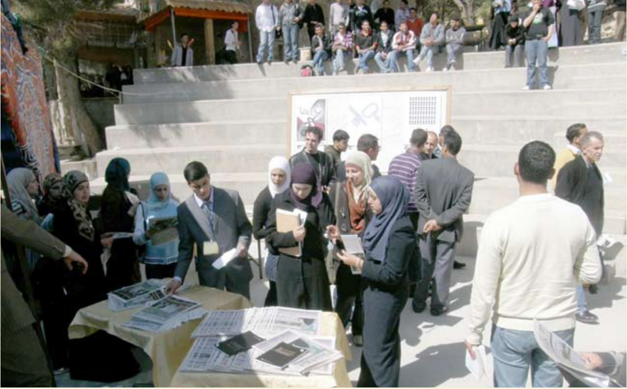
جانب من معرض «حق العودة مش للبيع»، جامعة القدس، ٢٢ آذار ٢٠٠٩.