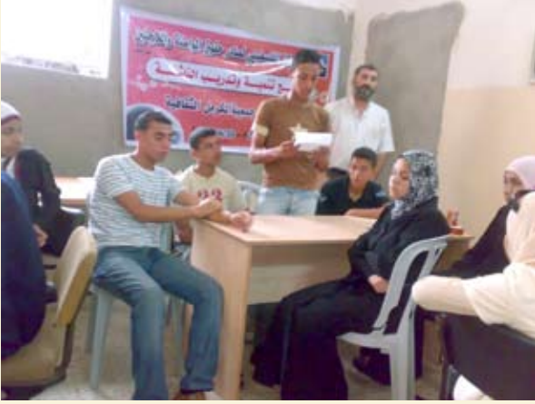
ضمن فعاليات برنامج تنمية وتدريب الناشئة، جمعية الكرمل الثقافية، مخيم خان يونس، غزة، ٢٤ تموز ٢٠٠٩.