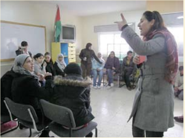
ضمن فعاليات برنامج تنمية وتدريب الناشئة، مركز لاجئ، مخيم عايدة، الضفة الغربية، ١٩ شباط ٢٠٠٩.