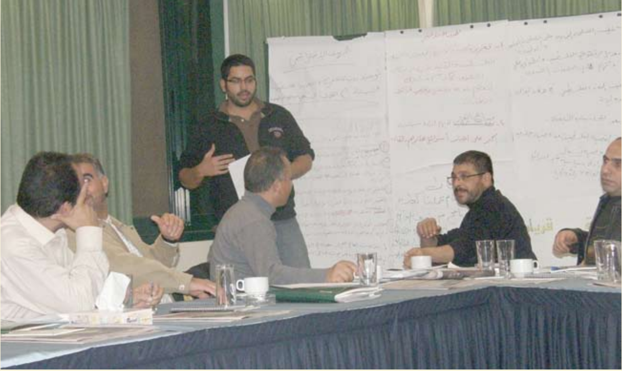
أحد جلسات العصف الفكري للمشاركين في ورشة العمل الاستراتيجية التي نظمها بديل في مدينة أريحا، كانون أول ٢٠٠٩.

بعقد لقاءات مع منظمين في بلغراد ومنظمين في كوسوفو. وقد أصبح جليا في هذه المرحلة؛ بأن الوضع في كوسوفو مختلف تماما عن ذلك الموجود في الوطن (صربيا)، والحقيقة الصادمة بشكل خاص هي أنه لا يوجد هناك نقاش بشأن «الحق» في العودة. ومع ذلك، لا تزال العودة غير قائمة في الممارسة العملية لأسباب مختلفة، ومن بينها الخوف الذي يشعر به العديد من اللاجئين، ووجود قضايا سياسية عالقة لم تتم تسويتها فيما بين الدول. ومن ثم قامت المجموعة بالتعلم بشكل رئيسي عن «عدم العودة» ومن خيبات الأمل والتحديات التي لا تزال بدون حلول. المرحلة الثانية: ورشات عمل مكثفة حول العودة الفلسطينية - أثناء التواجد في المعهد (CFCCS) في بلغراد، ناقشت المجموعة وبلورت مسودة أولية لورقة عمل تعالج الأمور التالية: أ) المسائل العملية المتعلقة بآليات العودة، ب) استعادة الممتلكات، ج) العدالة والمصالحة، د) التأهيل والاندماج. وسوف يجري المزيد من النقاش والتفصيل لمسودة الورقة تلك في عام ٢٠١٠ ضمن أنشطة المتابعة لبديل و«زخروت».