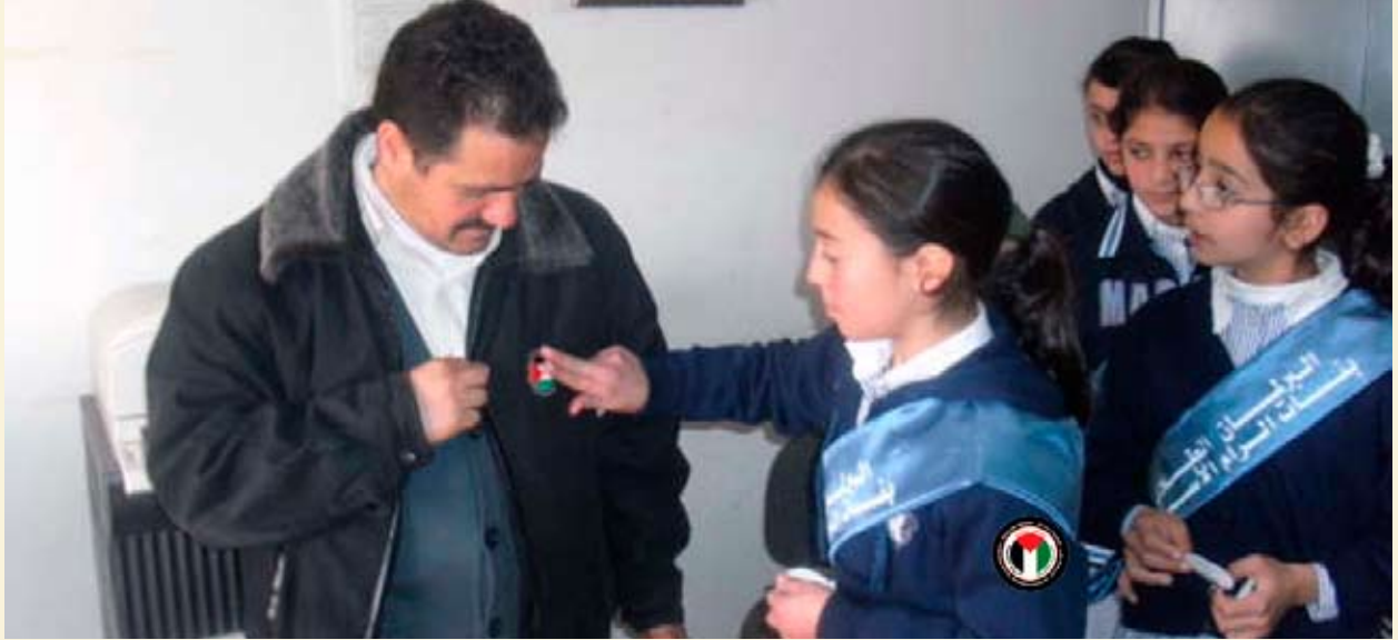
ضمن نشاطات إحياء ذكرى النكبة الـ ٦١، قامت طالبات مدرسة الرام الأساسية في القدس بجولة في مكاتب وزارة التربية والتعليم بهدف ترويج حملة مقاطعة إسرائيل. ١٧ أيار ٢٠٠٩.