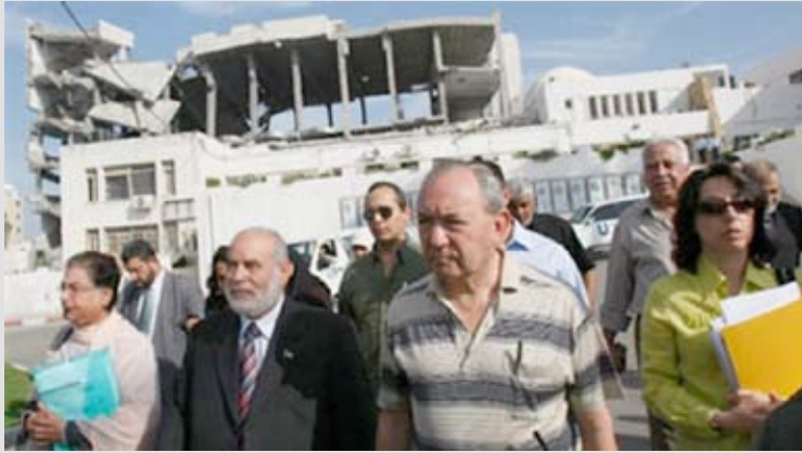
ريتشارد غولدستون في جولة تفقدية لحجم الأضرار في قطاع غزة، حزيران ٢٠٠٩

وفي نهاية المطاف، اصدرت الجمعية العامة للأمم على التقرير في قرارها رقم (A/Res/64/10) في ٥ تشرين ثاني ٢٠٠٩، والذي لم يتضمن أية تدابير فعالة لجبر الأضرار. وقد صوتت ١٨ دولة، من بينها العديد من الحكومات الأوروبية، ضد إخضاع إسرائيل للمساءلة والمحاسبة بموجب القانون الدولي، وامتنعت ٤٤ دولة عن التصويت. وعلى إثر ذلك، قام هذا الائتلاف الخاص للمنظمات غير الحكومية بإرسال رسائل مشتركة لوزراء خارجية السويد وهولندا تحثج فيه على مواقف الاتحاد الأوروبي والموقف الهولندي. كما قامت مؤسسة بديل بجمع توقيعات على رسالة تعبر عن الشكر والامتنان للدول الأوروبية التي صوتت لصالح قرار الجمعية العامة.