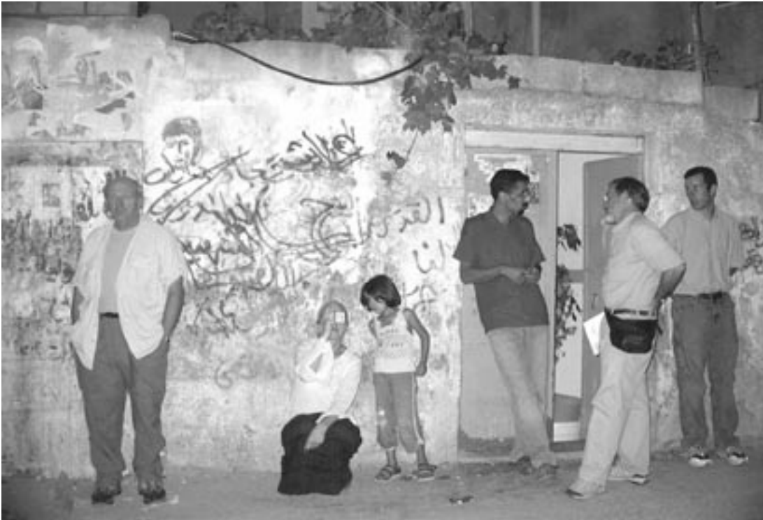
وفد من مجموعة مسيحيون من أجل السلام، في زيارة ميدانية لحجيم الدهيشة، ٢٠٠٦

- تم تشكيل مجموعة تضم عددا من المؤسسات غير الحكومية الفلسطينية والمنظمات الدولية بهدف القيام بالمراقبة والعمل الدعاوي المطلوب من أجل تطبيق فعال لعمل مسجل الأمم المتحدة الخاص بحصر وتسجيل الأضرار الناجمة عن بناء جدار الفصل العنصري الذي تقيمه إسرائيل في الضفة الغربية. (عمل هذه المجموعة لا زال متواصلا أيضا).