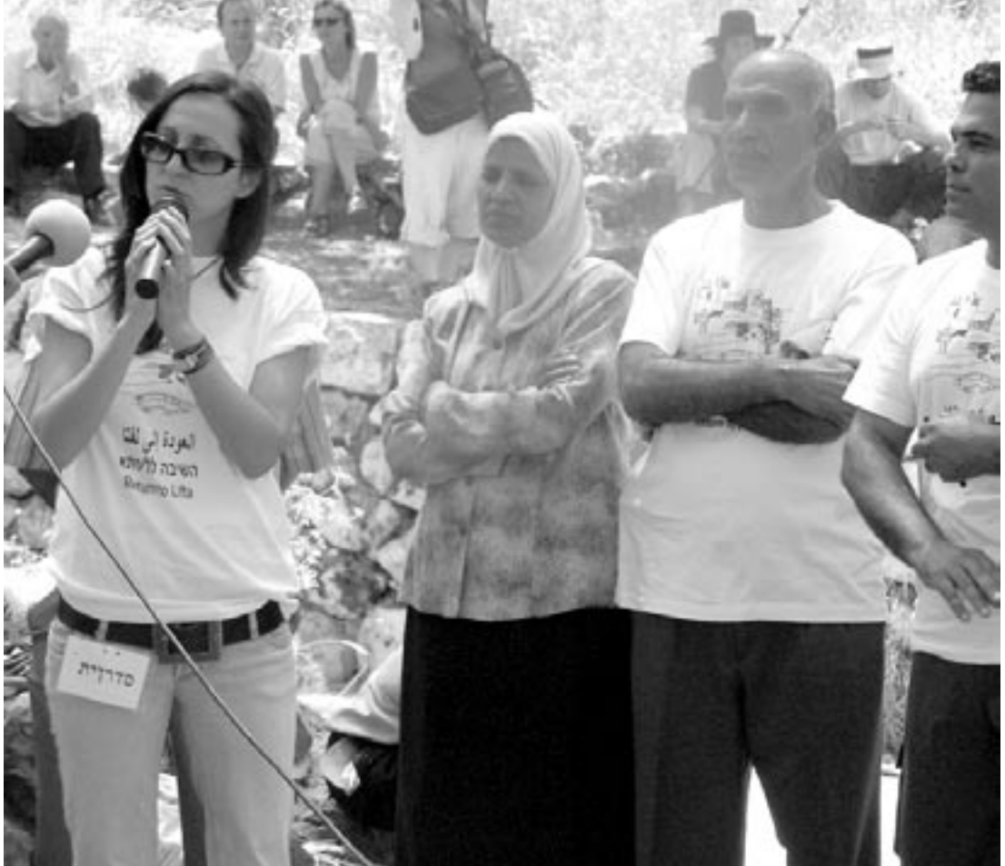
في زيارة لفريقنا المهجرة القدس. ٢٠٠٦