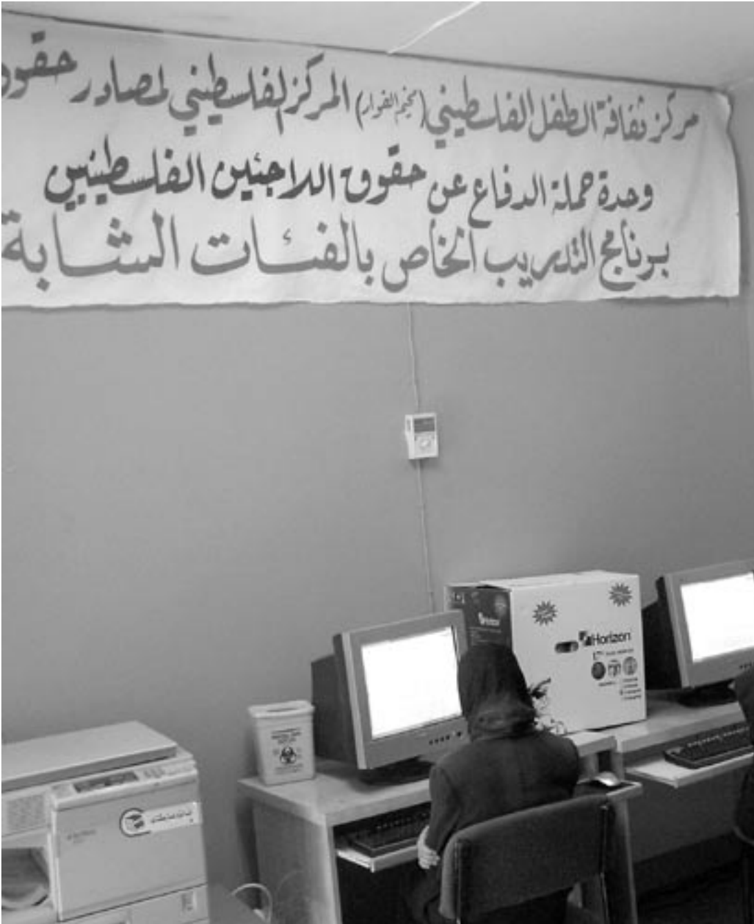
مركز ثقافة الطفل مخيم الفوار - الخليل ٢٠٠٦