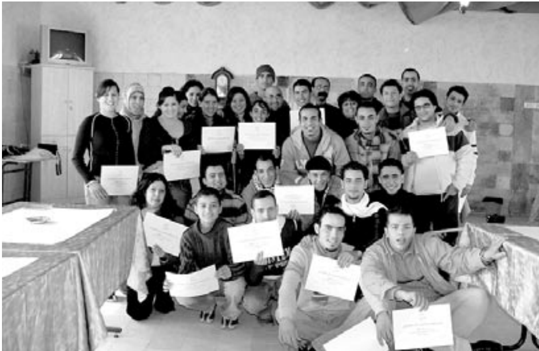
صورة من حفل تخريج فرقة المسرح > مركز الفينيق > مخيم الدهيشنة ٢٠٠٦