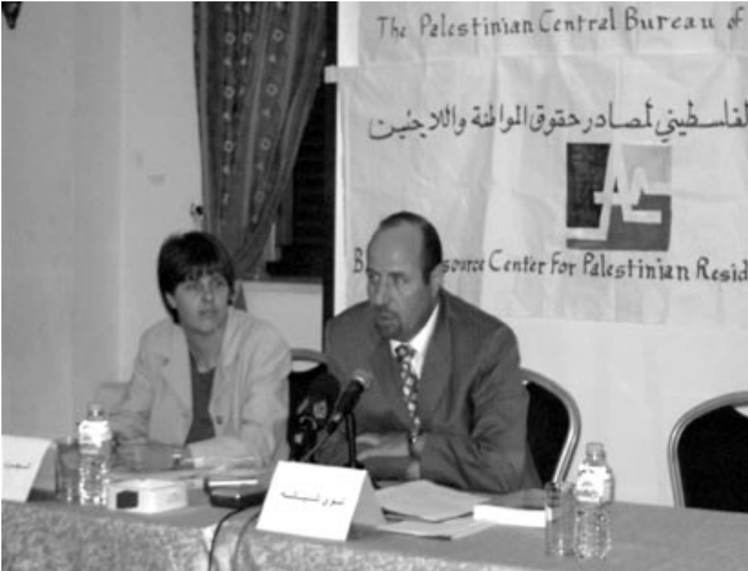
مؤتمر صحفي مشترك مع جهاز الاحصاء المركزي. تموز ٢٠٠٦.