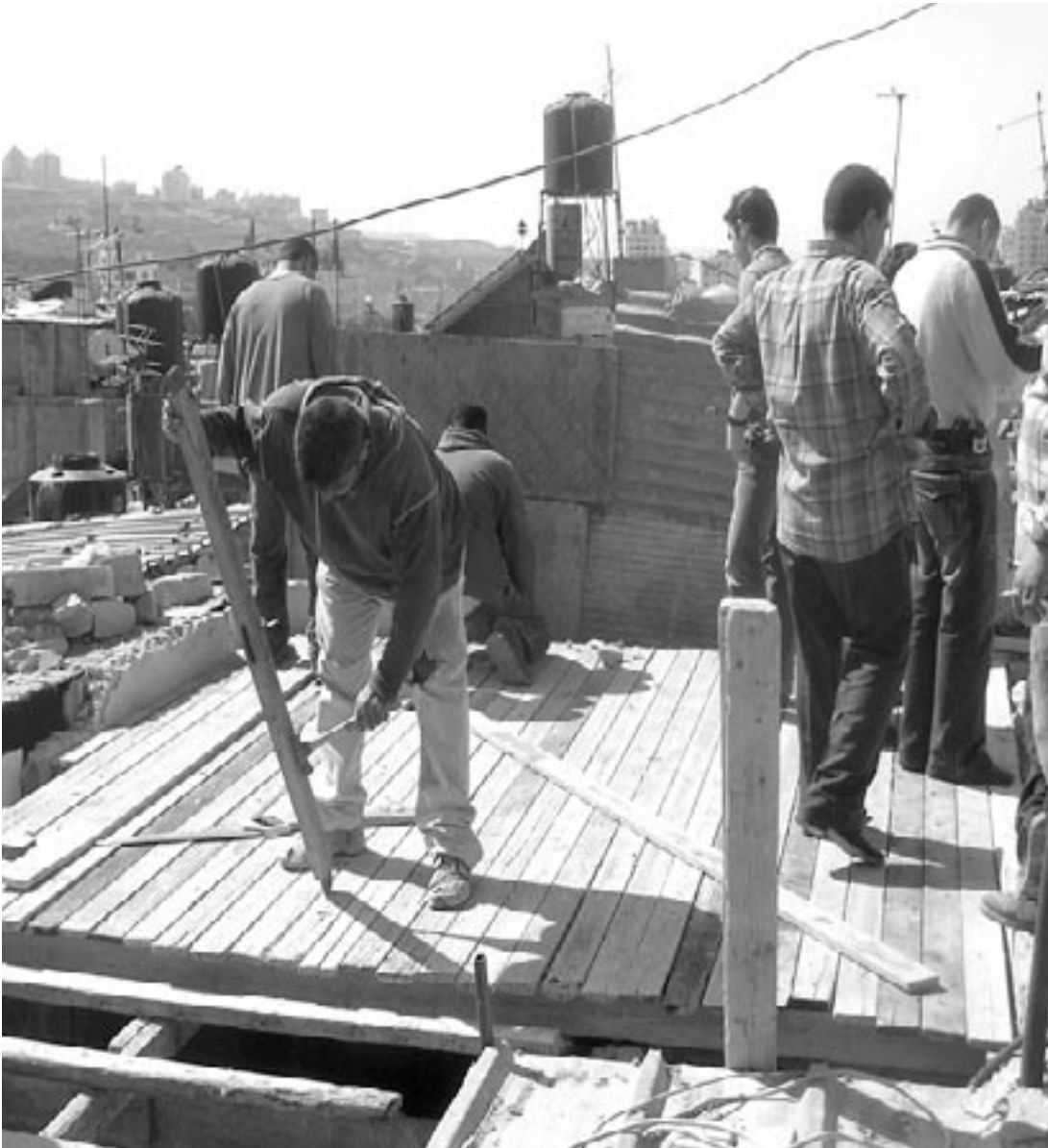
جانب من أعمال مشروع الطوارئ في مخيم طولكرم، ٢٠٠٦