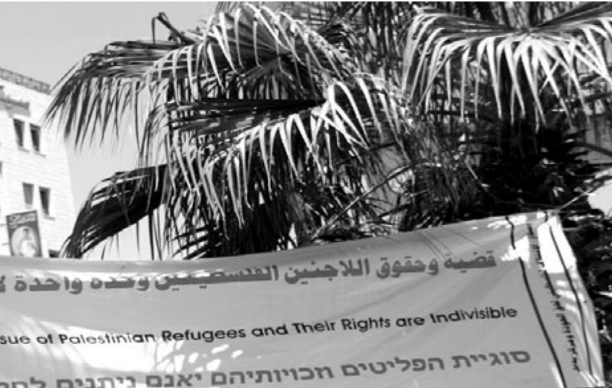
ضمن فعاليات إحياء ذكرى النكبة، رام الله ٢٠٠٦

- تم تعيين منسق كفو و دائم للإعلام باللغة العربية في صيف عام ٢٠٠٦. وتم تجديد الاعلان عن الشاغر الوظيفي لمنسق الاعلام باللغة الانجليزية مع نهاية عام ٢٠٠٦ ايضاً. - يجب على بديل العمل على تحقيق إنسياب إضافي في برنامج بديل خلال تصميم خطة العمل الثلاثية الجديدة في عام ٢٠٠٧؛ وذلك من اجل تخفيف عبء العمل على الطاقم التنفيذي وتوفير الوقت الكافي للقيام بالمهام على اكمل وجه.