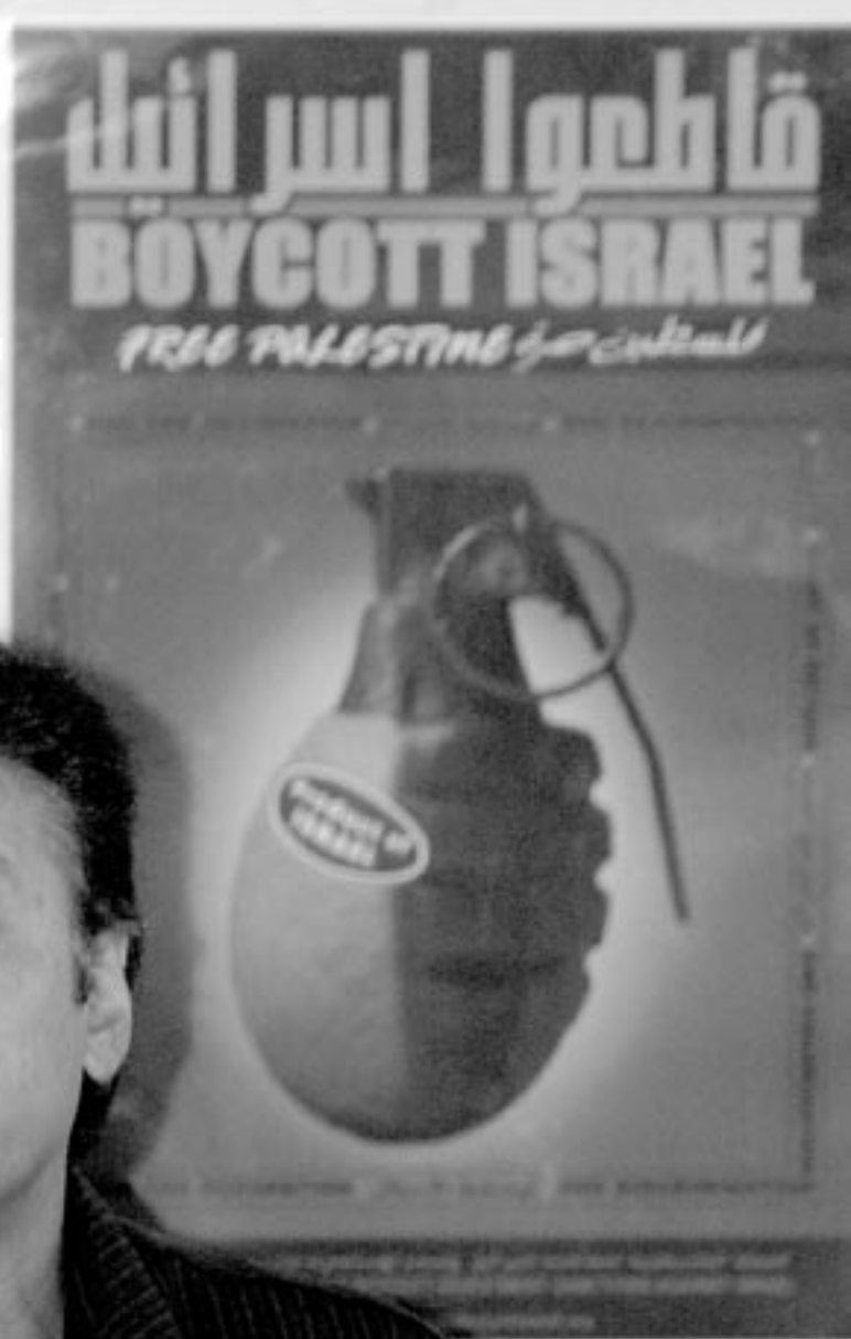
مؤتمر صحفي للإعلان عن إطلاق حملة المقاطعة في جنوب أفريقيا، ٢٠٠٦