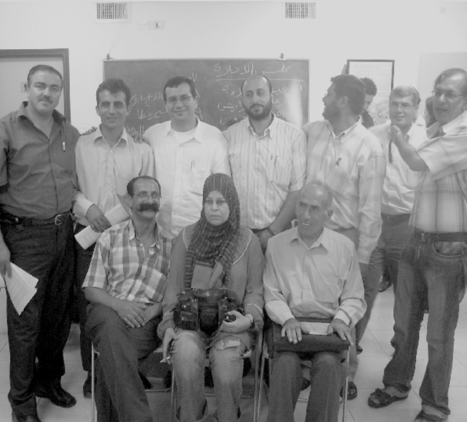
صورة لأعضاء من مجلس إدارة مركز بديل ولجنة الرقابة بعيد انتخابهم (١٤ أيلول ٢٠٠٦)