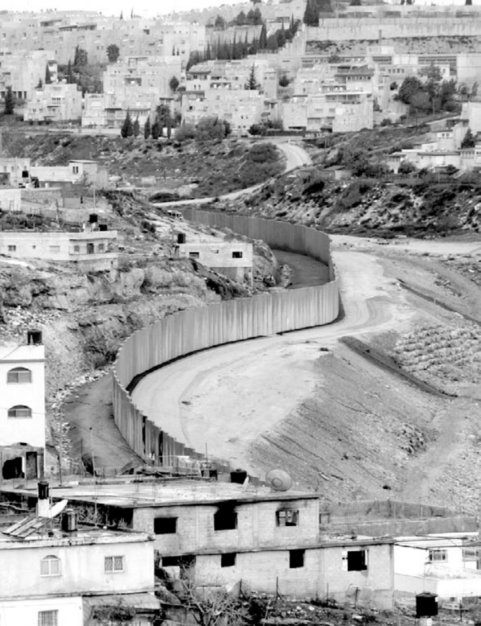
جدار الفصل العنصري بالقرب من عناتا - القدس.