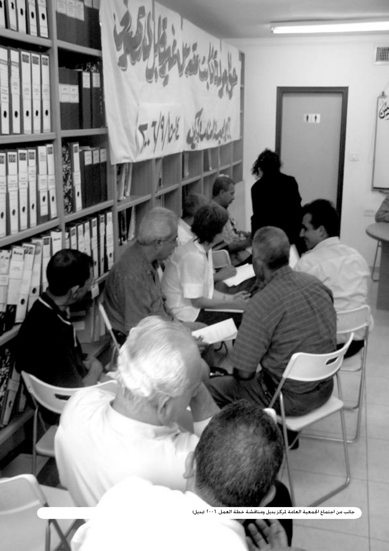
جانب من اجتماع الجمعية العامة لمركز بديل ومناقشة خطة العمل. ٢٠٠٦