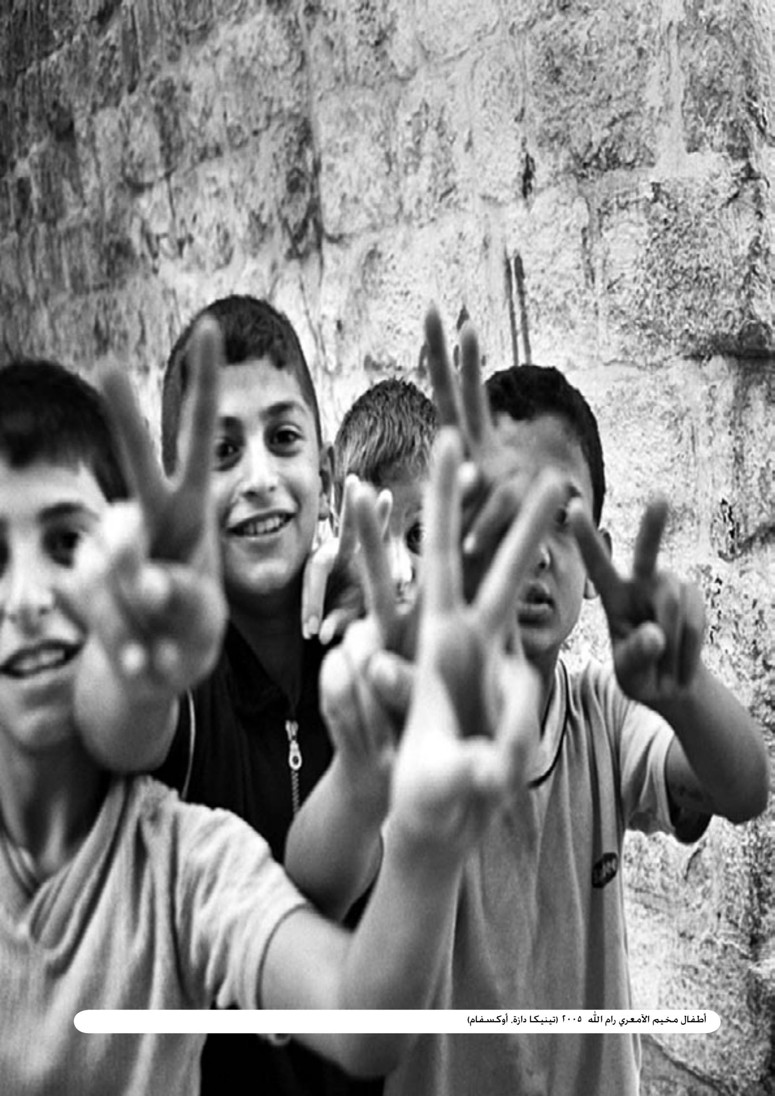
أطفال مخيم الأمعري رام الله ٢٠٠٥