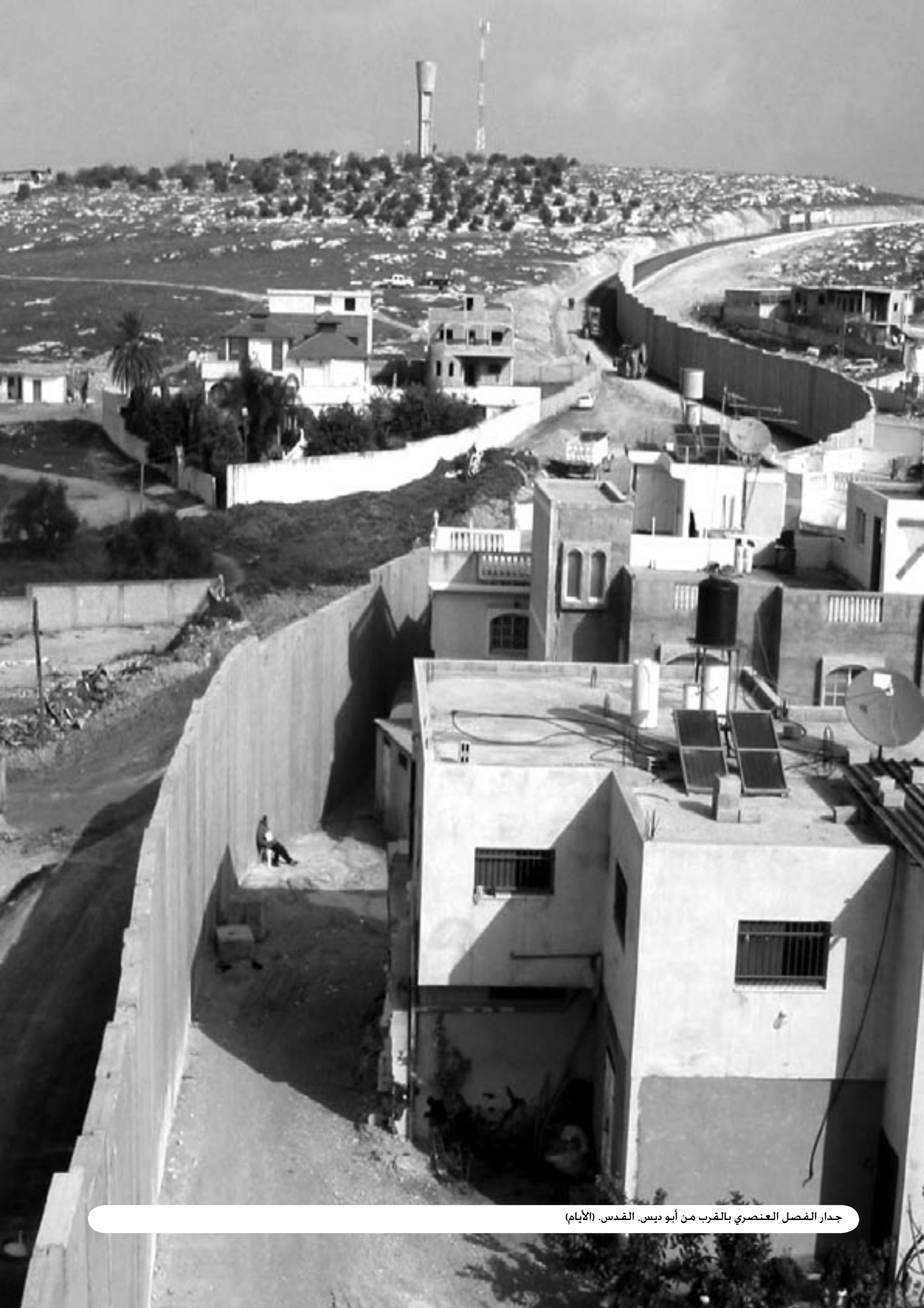
جدار الفصل العنصري بالقرب من أبو ديس، القدس.